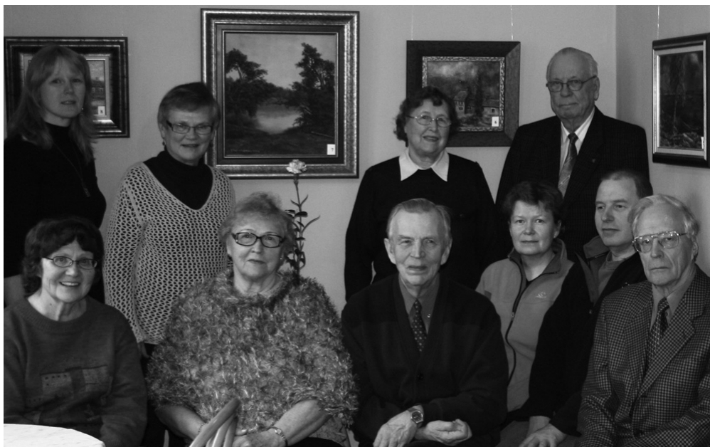
Kuopion seudun alaostaston vuosikokousväki.

Seuraava työryhmän kokous pidetään lauantaina 7.6.2008 Savonlinnassa. Aika sovitaan paikan päällä.