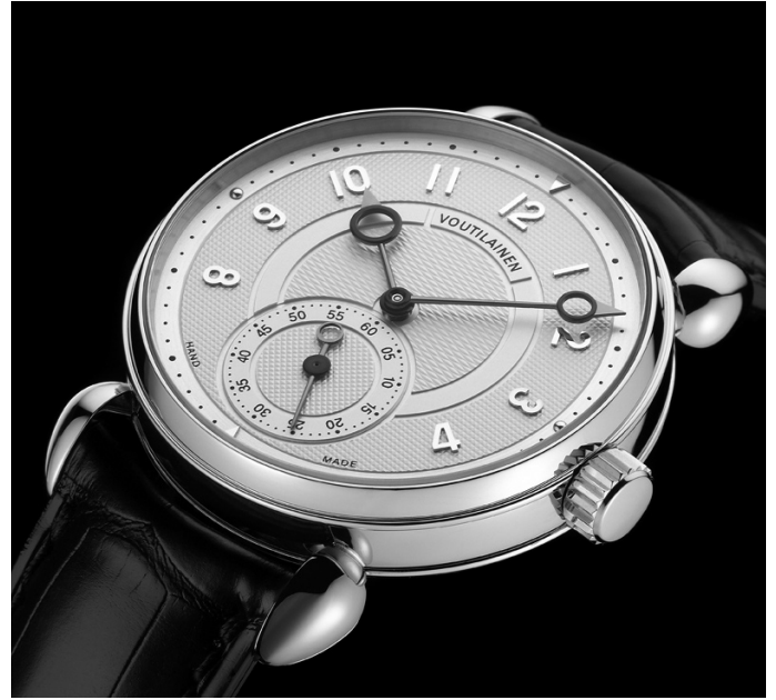
Kelloseppämestari ja mestarin kello.