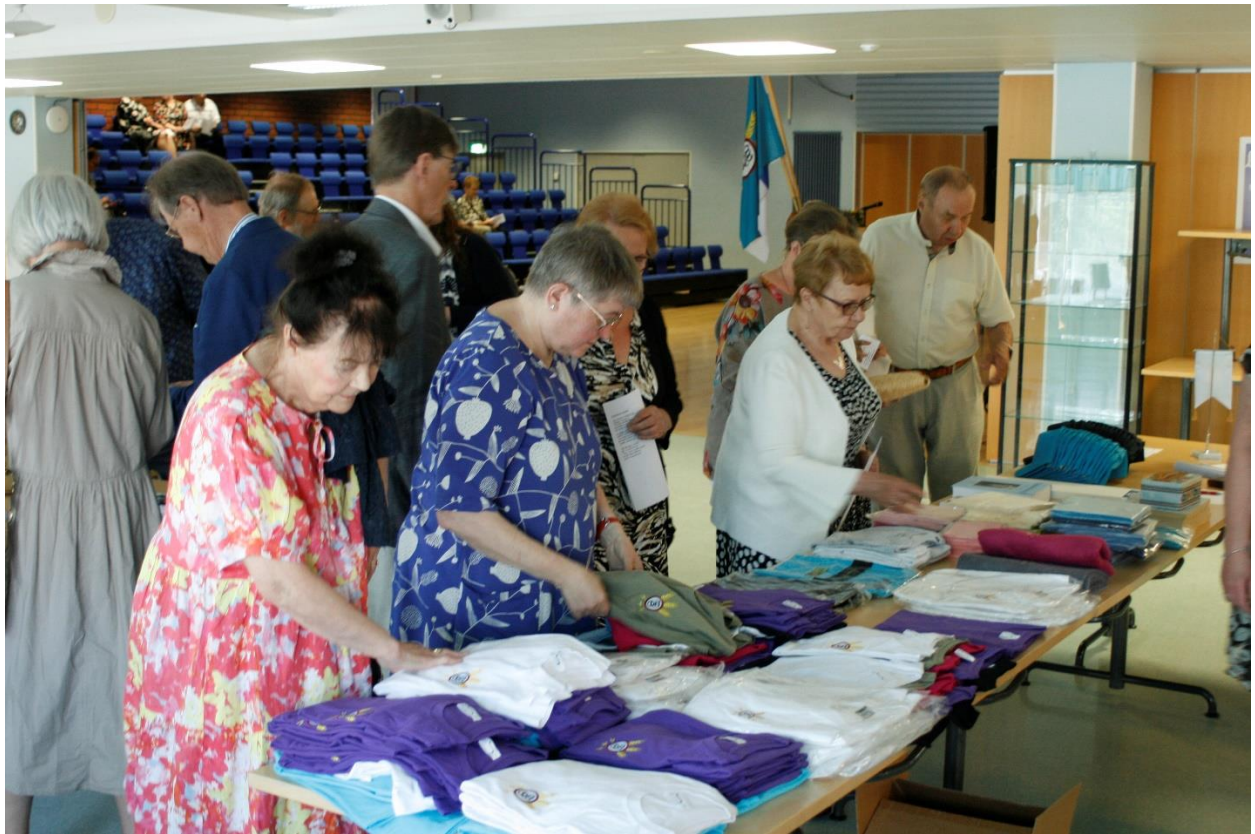
Sukutuotteet kiinnostivat ja kävivät hyvin kaupaksi