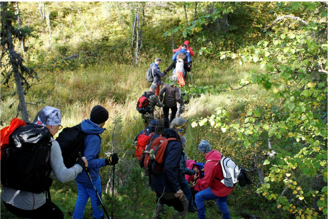
Matkalla Varkhaan kodalle poikettiin opastetulta reitiltä