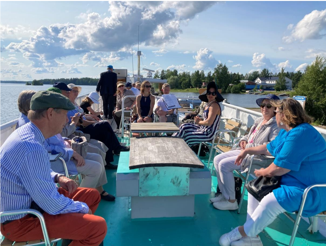
Risteily Juojärvellä sujui leppoisissa tunnelmissa.