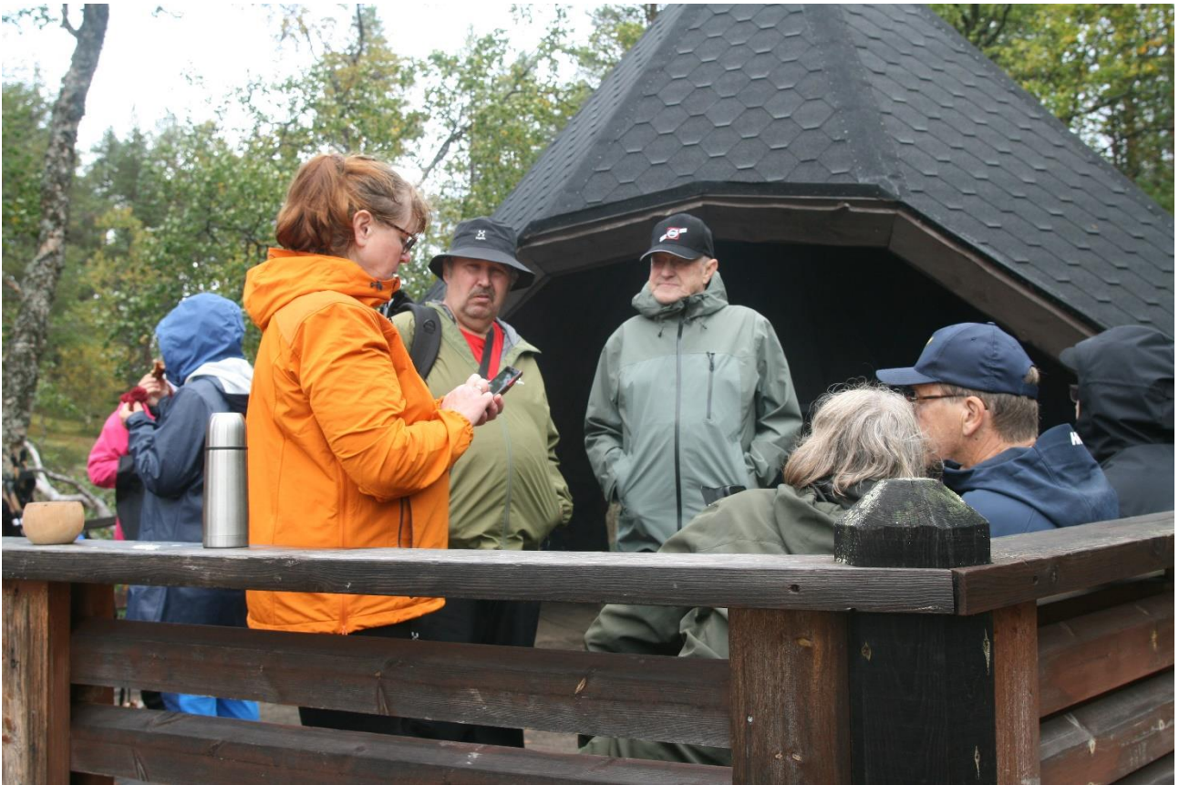
Kodalla oli mukava huilata, paistaa makkaraa ja jutella kuulumiset