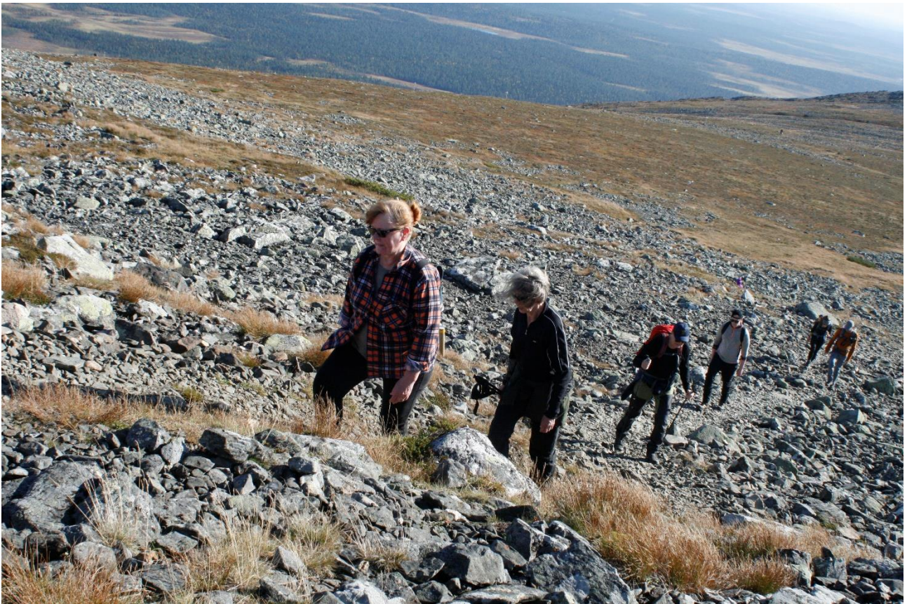
Kiipeämässä Taivaskerolle, jossa sytytettiin 1952 Helsingin Olympialaisten olympiatuli