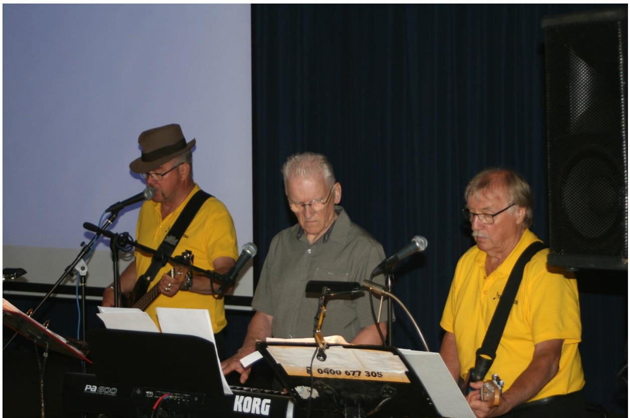
Orkesteri houkutti rohkeimmat jopa tanssimaan