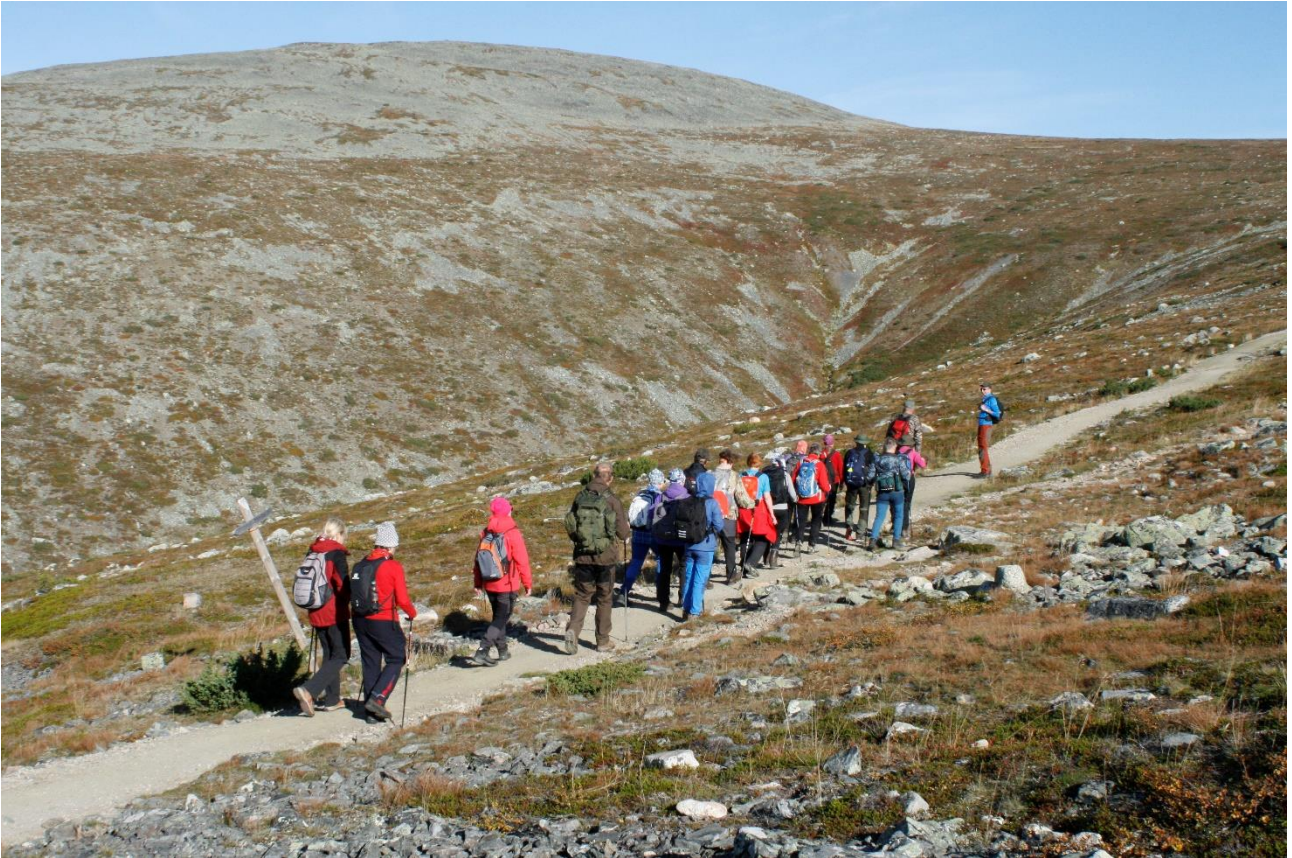
Matkalla Pallaksen Taivaskerolle